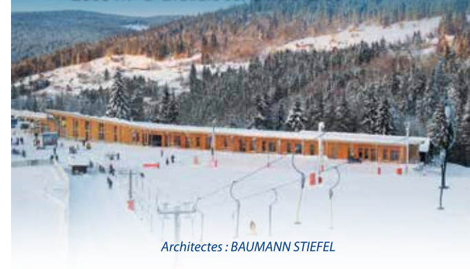
Architectes : BAUMANN STIEFEL