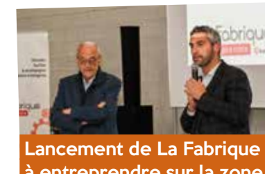
Lancement de La Fabrique à entreprendre sur la zone d'activité de Reffye - septembre

Le CTEAC de l'Agglo a été signé à Socourt, avec l'État et le Département, après une longue étape de concertation avec les différents acteurs culturels du territoire. Il vise à coordonner les actions menées par l'agglomération. L'itinérance culturelle est au cœur de cette convention grâce à la Micro-Folie composée de 11 roulottes qui sillonnent le territoire et le dispositif « Caravelle » qui favorise la mobilité des élèves vers les équipements culturels.