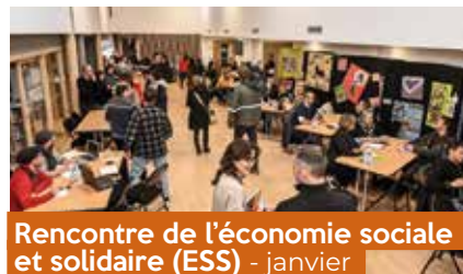
Rencontre de l'économie sociale et solidaire (ESS) - janvier

Organisée par l'agglomération d'Épinal en collaboration avec la Chambre régionale de l'Économie Sociale et Solidaire Grand Est, cette rencontre de type « speed dating » a réuni, à la Maison de l'Habitat, les structures de l'ESS ainsi que des acheteurs publics. L'objectif était de rassembler acteurs et acheteurs autour de solutions locales et d'encourager ainsi le développement d'une nouvelle forme d'économie.