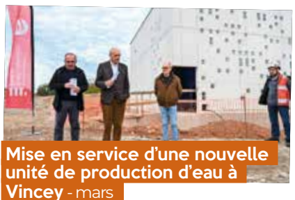
Mise en service d'une nouvelle unité de production d'eau à Vincey - mars

Les communes de Dounoux et Xertigny ont signé une charte d'engagement avec l'agglomération d'Épinal, en faveur de la création d'un plan de mobilité scolaire. Ce plan vise à réduire la dépendance à la voiture individuelle pour les trajets domicile-école et à favoriser la mobilité douce, comme la marche et le vélo.