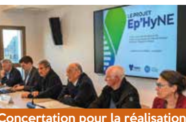
Concertation pour la réalisation du projet Ep'HyNE - avril

Avec le soutien de : État, Département, Agence de l'Eau