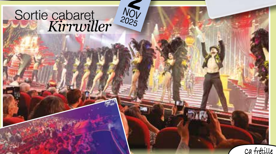
Sortie cabaret Kirrwiller