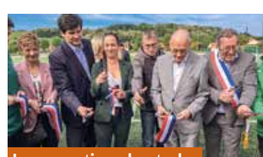
Inauguration du stade synthétique des Charmottes à Charmes - mai

Lors de cette 2 ème édition, 4 000 participants dont près de 1 000 enfants ont pris part au festival tous vélos. Ouvert pour la 1 ère fois aux entreprises en 2025, le festival vous donne rendez-vous les 1, 2 et 3 mai 2026 pour la prochaine édition.