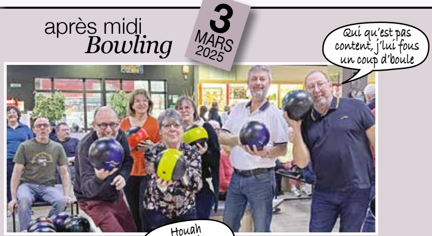
après midi Bowling