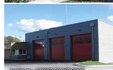
Architectes : CASSIER FELDER SIDOT