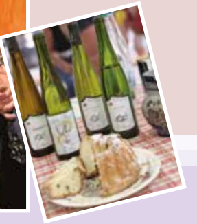
Visite dégustation Maison Schiele à Ammerschwihr

Elle cause, elle cause, les tonneaux sont pleins, mais nos verres sont vides. Paroles de gilles