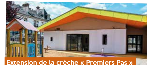
Extension de la crèche « Premiers Pas » - juillet

Entrant dans un vaste programme de gestion intégrée des eaux pluviales et d'accompagnement des communes, ce projet de restructuration comprend notamment un revêtement de la place en pavés drainants, la désimperméabilisation de 2 217 m² ainsi qu'un nouvel éclairage public et la création d'un abribus. L'agglomération d'Épinal a contribué financièrement à ce projet par sa compétence de gestion intégrée des eaux pluviales.