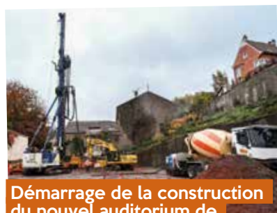
Démarrage de la construction du nouvel auditorium de La Louvière à Épinal - avril

Une concertation préalable a été menée en amont du projet Ep'HyNE (Épinal Hydrogène et Nouvelles Énergies), d'un montant de 1,4 milliard, pour relever les impacts du projet sur l'environnement, le cadre de vie et l'activité économique du territoire. L'instruction du dossier en 2026, comprendra une enquête complémentaire, lors de la phase d'instruction du projet.