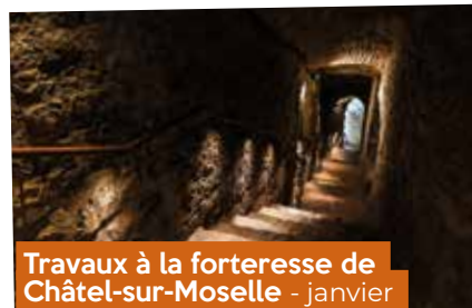
Travaux à la forteresse de Châtel-sur-Moselle - janvier

Organisée par l'agglomération d'Épinal en collaboration avec la Chambre régionale de l'Économie Sociale et Solidaire Grand Est, cette rencontre de type « speed dating » a réuni, à la Maison de l'Habitat, les structures de l'ESS ainsi que des acheteurs publics. L'objectif était de rassembler acteurs et acheteurs autour de solutions locales et d'encourager ainsi le développement d'une nouvelle forme d'économie.