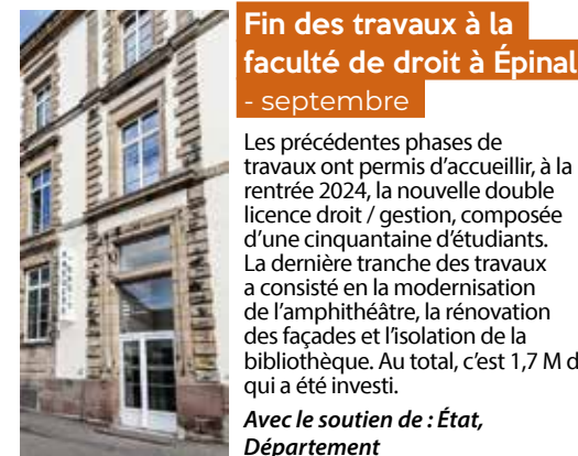
Fin des travaux à la faculté de droit à Épinal - septembre

L'État, la Région, l'Agglo d'Épinal, la ville de Thaon-les-Vosges et l'EPFGE se sont réunis pour parapher la convention « Opération de revitalisation de territoire » qui vise à soutenir les stratégies de redynamisation des centralités. Pour Thaon, les enjeux s'articulent autour de la lutte contre la vacance des logements, le commerce local et la préservation du patrimoine industriel. Dans le même temps, un avenant au dispositif « ACCOR » a été signé afin de permettre à Thaon d'en bénéficier.