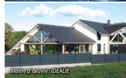
Maitre d'œuvre : IDEALIE