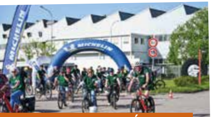
Festival Enjoy Vélos Épinal et son agglomération - mai

Avec le soutien de : État, Région, Département