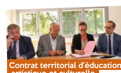
Contrat territorial d'éducation artistique et culturelle (CTEAC) - septembre

Avec le soutien de : Région, Département, ADEME