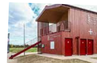
Construction d'un poste de secours au domaine des Lacs à Thaon-les-Vosges - octobre

Le théâtre a été transféré en 2007 et le reste du site en 2023. Ils sont à ce jour communautaires et feront l'objet d'un audit d'une durée d'un an, dont l'enjeu est d'aboutir à une vision globale du bâtiment, de ses extérieurs et de ses usages. Un programme des travaux sera établi pour les années à venir.