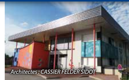
Architectes : CASSIER FELDER SIDOT

ATELIER CHARPENTE BOIS : Au devant des Brayes - 88460 CHENIMÉNIL Tél. : 06 80 44 05 37 arnaud.poirot1@orange.fr