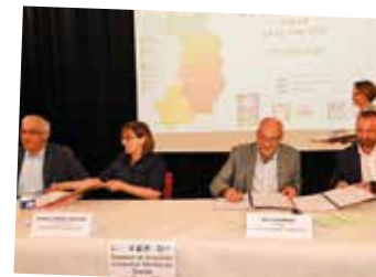
Nouvelle convention territoriale globale - juin

Signée avec plusieurs partenaires (CAF, MSA et le Conseil départemental des Vosges), la convention d'une durée de 5 ans vise à renforcer la cohérence et la coordination des projets sur l'ensemble des thématiques de politique sociale (logement, parentalité, petite enfance, jeunesse, etc.).