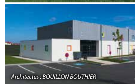
Architectes : BOUILLON BOUTHIER