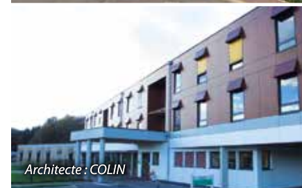
Architecte : COLIN