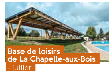
Base de loisirs de La Chapelle-aux-Bois - juillet

Afin de donner plus de lisibilité au site, d'améliorer son attractivité touristique et de renforcer le confort des usagers, des travaux ont eu lieu avec l'installation d'une ombrière, d'une pompe à chaleur air / eau permettant de chauffer l'eau du bassin et l'aménagement de la zone naturelle. La fin des travaux prévue en 2026 permettra la création d'une aire de camping-cars et la désimperméabilisation des places de stationnement.