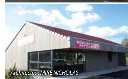
Architectes : MIRE NICHOLAS