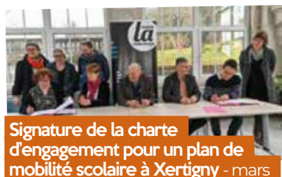
Signature de la charte d'engagement pour un plan de mobilité scolaire à Xertigny - mars

4 structures en bois accueillent 336 panneaux photovoltaïques sur le parking de la Base Natur'O. Plus de 130 000 kWh seront produits dans le cadre d'une autoconsommation collective qui alimente notamment le stade d'eaux vives.