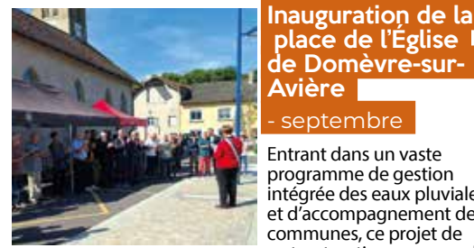
Inauguration de la place de l'Église de Domèvre-sur-Avière - septembre

Entrant dans un vaste programme de gestion intégrée des eaux pluviales et d'accompagnement des communes, ce projet de restructuration comprend notamment un revêtement de la place en pavés drainants, la désimperméabilisation de 2 217 m² ainsi qu'un nouvel éclairage public et la création d'un abribus. L'agglomération d'Épinal a contribué financièrement à ce projet par sa compétence de gestion intégrée des eaux pluviales.