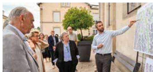
Convention « Opération de revitalisation de territoire » à Thaon-les-Vosges - juillet

Signée avec plusieurs partenaires (CAF, MSA et le Conseil départemental des Vosges), la convention d'une durée de 5 ans vise à renforcer la cohérence et la coordination des projets sur l'ensemble des thématiques de politique sociale (logement, parentalité, petite enfance, jeunesse, etc.).