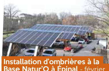
Installation d'ombrières à la Base Natur'O à Épinal - février

Avec le soutien de : État, Région, Département